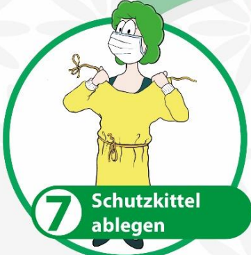
7 Schutzkittel ablegen