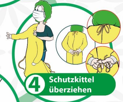
4 Schutzkittel überziehen