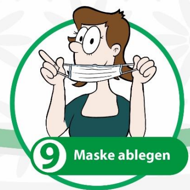
9 Maske ablegen