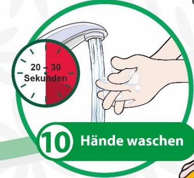
10 Hände waschen