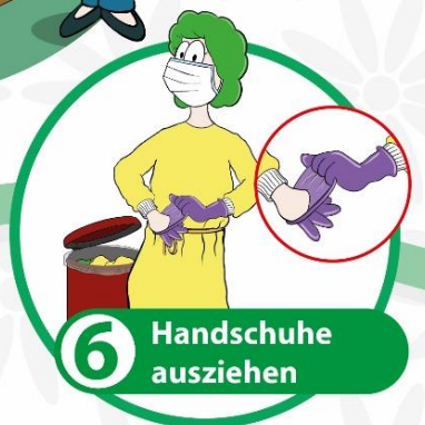
6 Handschuhe ausziehen