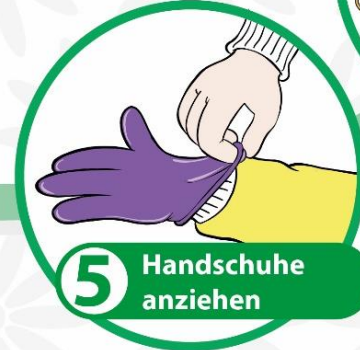
5 Handschuhe anziehen