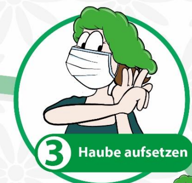
3 Haube aufsetzen