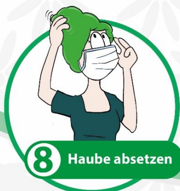
8 Haube absetzen