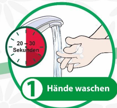
1 Hände waschen