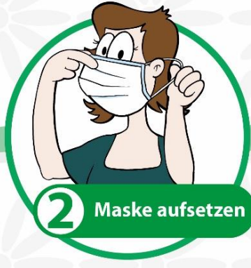
2 Maske aufsetzen